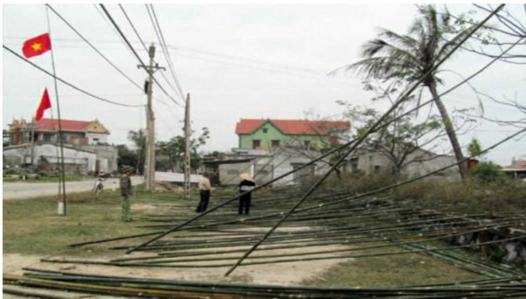
Người dân dựng cây nêu đón tết. Ảnh minh họa

LĐO | 26/01/2021 | 14:17 Like Thích Chia sẻ 99 người thích nội dung này. Hãy là người đầu tiên trong số bạn bè của bạn.